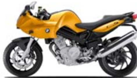
sunset gelb uni